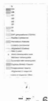
Carte de l'évolution du zonage (principe présenté en réunions de quartier en janvier 2012 et en réunion publique en juin 2012).